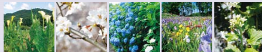
カラー 桜 あじさい ジャーマンアイリス わさびの花

信州新町の特産品として、地域に点在し畑を彩る梅、山わさび、カラー。地元の人々が育て、手入れをしている桜、ジャーマンアイリス、あじさい。里山に咲く草花木花が春を彩る信州新町を華やかに演出します。折々の祭りやイベントでお楽しみください。